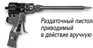
Раздаточный пистолет, приводимый в действие вручную